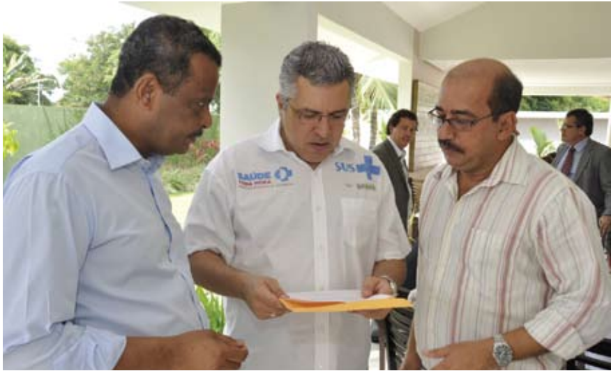
Dirigentes do Sindsprev-PE entregam documento ao ministro Alexandre Padilha solicitando apoio na Mesa Setorial Permanente de Negociação da Saúde

O coordenador geral do Sindsprev-PE, José Bonifácio, entregou no dia 19 de dezembro, ao Ministro da Saúde Alexandre Padilha, documento solicitando-lhe apoio na Mesa Setorial Permanente de Negociação da Saúde.